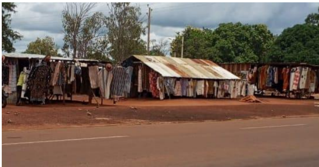
Photo 1. Marché de vêtements traditionnels à Korhogo

Les villes hôtes des universités régionales sont des pôles économiques régionaux déjà structurés. Avant l'université, Daloa et Korhogo, par exemple, étaient déjà des centres économiques stratégiques exerçant des fonctions de carrefours logistiques et commerciaux. Daloa constitue la plateforme des échanges agricoles (cacao, café, hévéa) et le carrefour de la RN5 et de la RN6 reliant les régions de la Marahoué, le Bas-Sassandra, le Guémon et le Worodougou.