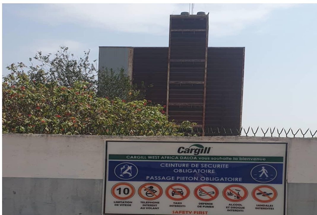
Photo 2. Unité industrielle de transformation de cacao

Ces atouts économiques ont encouragé la décentralisation universitaire afin d'accompagner les pôles productifs. Concernant la modernisation de l'économie régionale, la Côte d'Ivoire cherche, depuis les réformes des années 2010, à renforcer les économies régionales, promouvoir l'innovation locale, réduire la dépendance à Abidjan. Les universités deviennent alors des catalyseurs de modernisation régionale. Dès 2012 l'État a fait de l'enseignement supérieur un levier de développement régional, à travers la diversification des formations (agronomie, logistique, géosciences, santé), la formation d'une main-d'œuvre locale adaptée aux filières productives. C'est dans ce sens que l'Université Peleforo GON COULIBALY (Korhogo) renforce les formations en agronomie et industrie agroalimentaire appuyant les filières coton et anacarde. L'université Jean Lorougnon Guédé développe des pôles en environnement, foresterie et développement durable, en lien avec la région forestière.