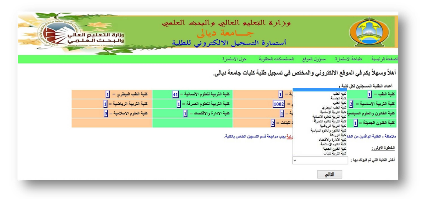
Fig.2 : Screenshot from Home Page of Online Registration web browser, Mozilla Firefox.