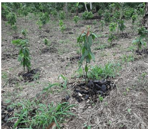
a) Coques de cacao étalées autour des jeunes cacaoyers