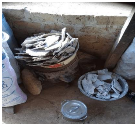
b) Blocs de Potasse