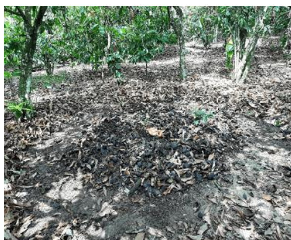
a) Coques de cacao en tas

La durée de compostage varie entre 3 et 6 mois. Il est réalisé de façon archaïque dans les fosses creusées dans les plantations. Le compost obtenu est entièrement appliqué sous les cacaoyers. La figure 3 présente un tas de coques prêt à être composté (Figure 3a) et une fosse compostière (Figure 3b).