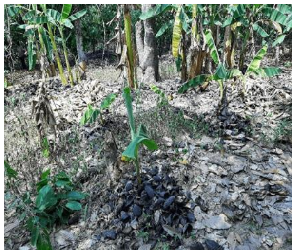
b) Coques de cacao étalées autour des jeunes bananiers