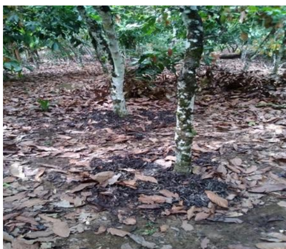
a) Rachis étalés autour des cacaoyers

Les rachis ou placenta de cacao sont également utilisés par 9,6% des producteurs en épandage sous les cacaoyers. En dehors de l'épandage, certains les séchent pour les utiliser dans la nutrition des animaux. La figure 5 présente les rachis étalés sous des cacaoyers (figure 5a) et séchés (figure 5b).