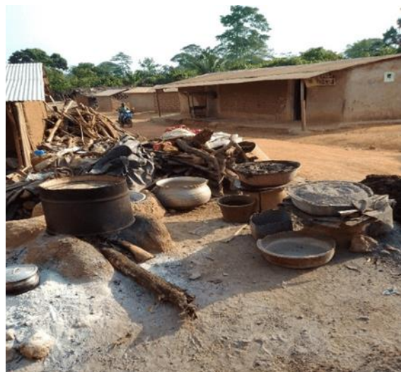
a) Matériel de fabrication de la potasse