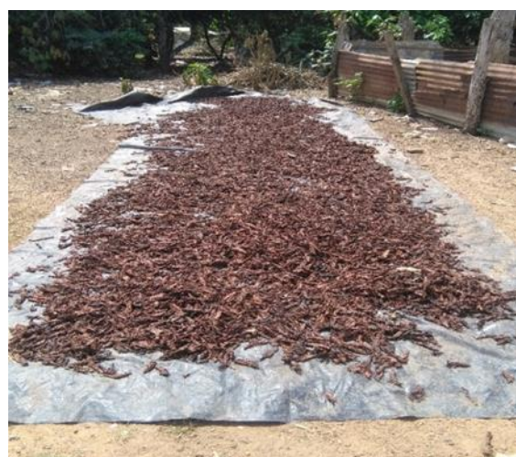
b) Rachis séchés pour nutrition animale