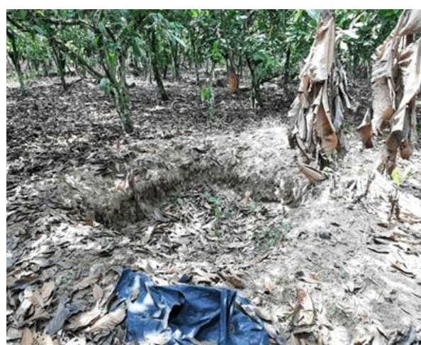
b) Fosse compostière