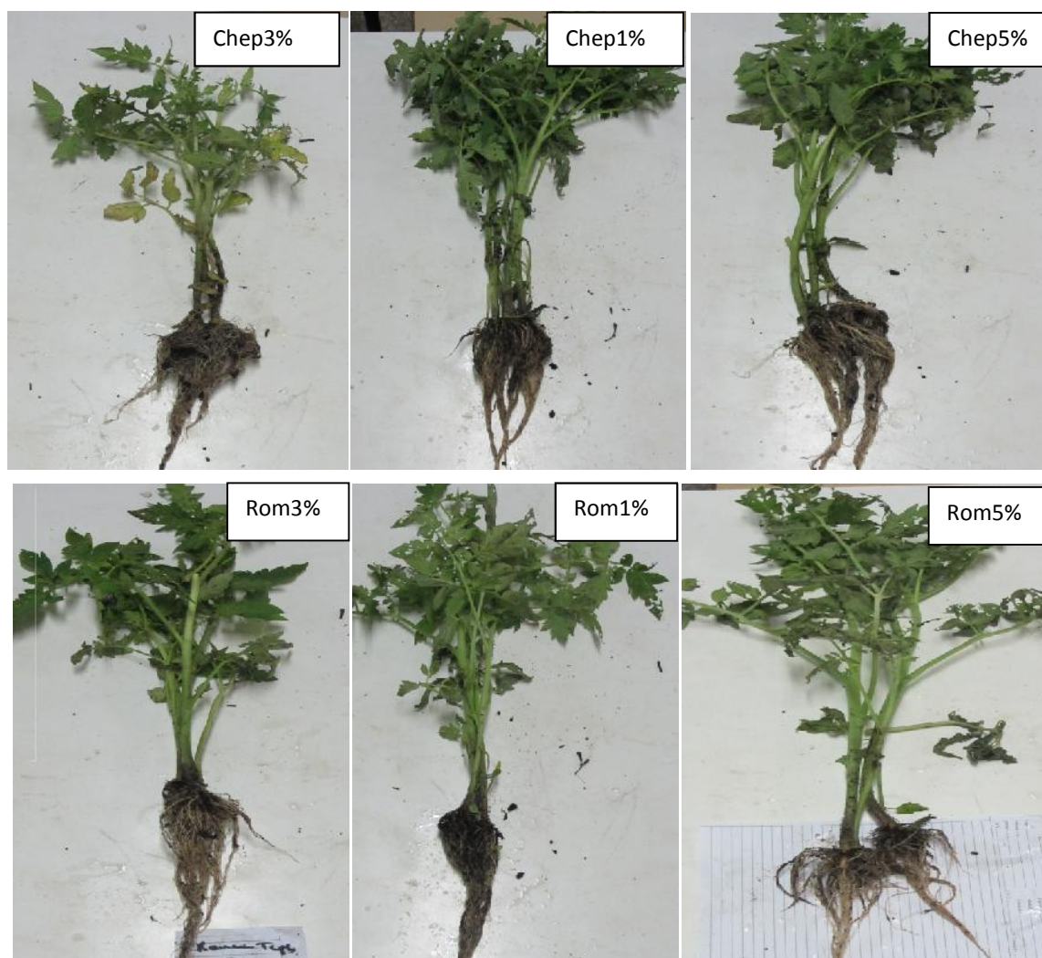
Figure 1 : Effet des extraits aqueux de Rosmarinus officinalis L et de Chenopodium ambrosioides L sur les paramètres de croissance de la tomate inoculée par Xanthomonas fragariae Dw.

L'analyse de la variance au seuil de 5% a montré que les six traitements des extraits de plantes induisaient la meilleure réponse de sur le poids frais aérien.