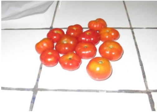
Fig. 3. Rouge aplati