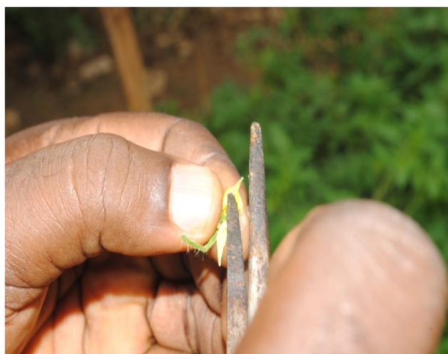
Fig. 11. Récolte du pollen