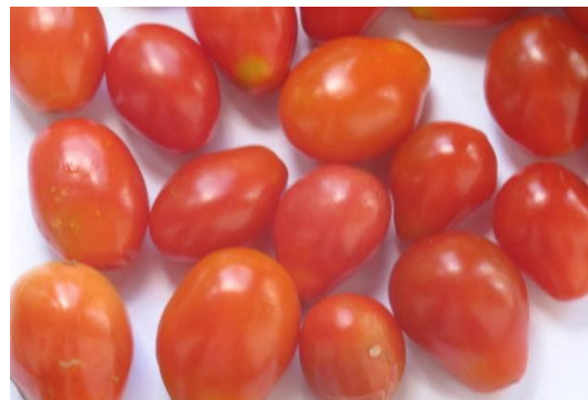
Fig. 6. Rouge allongé

Les variétés sont illustrées par les figures 7 et 8.