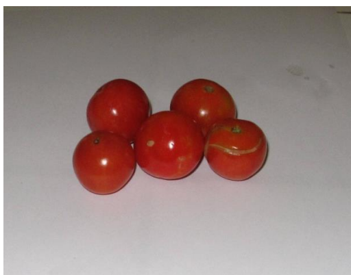
Fig. 1. Rouge rond

Le matériel utilisé dans cette recherche a été constitué de lignées de tomate issues de deux variétés étrangères (Roma et Makis) et celles dérivées des variétés locales (Rouge rond, Violet rond, Rouge aplati, Violet aplati, Rouge allongé et Violet allongé). L'analyse génétique des plantes parentales a porté sur le rythme de croissance, les nombres de fleurs, de fruits et poids de fruit par plante. Ces variétés sont illustrées par les figures 1 à 8.