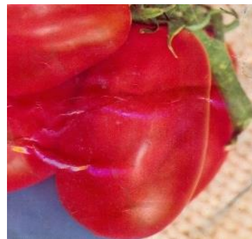
Fig. 8. Variété Roma