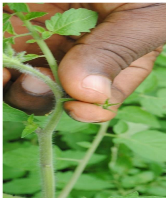
Fig. 10. Fin de la castration manuelle