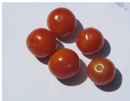
Fig. 2. Violet rond