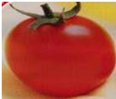
Fig. 7. Variété Makis

Les variétés sont illustrées par les figures 7 et 8.