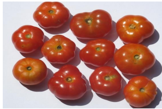
Fig. 4. Violet aplati