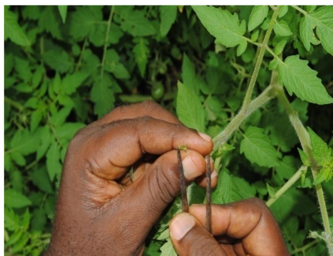
Fig. 12. Dépôt des pollens sur stigmate (Ensachage et étiquetage)

La vérification d'une inflorescence pollinisée après 10 jours est illustrée par la figure 13.