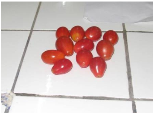
Fig. 5. Violet allongé