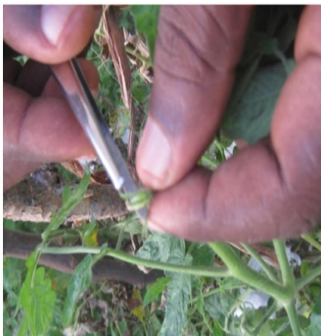
Fig. 9. Début castration manuelle

La castration des étamines, la récolte du pollen et la pollinisation sont représentées par les figures 9 à 12.