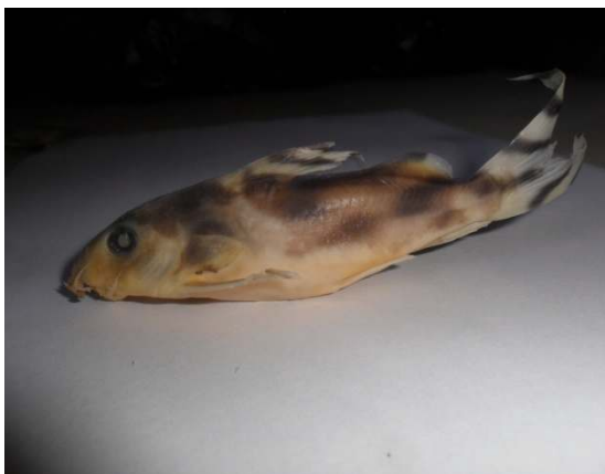
Fig. 4. Synodontis decorus

Règne : Animal Embranchement : Chordata Sous-embranchement : Vertebrata Super-classe : Osteichthyes Classe : Teleostei Sous-classe : Actinoptérygiens Ordre : Siluriformes Famille : Mochokidae Genre : Synodontis Espèce : Synodontis pleurops , Boulenger 1897.