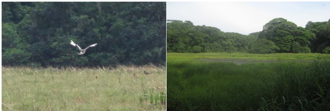
Photo 6 : Galeries forestières de savane/territoire de Kibombo et de Namoya/territoire de Kabambare

Appart ces galeries savaniques, il existe aussi des vastes savanes proprement dites, telle que celle de Okona à 132Km 2 de Kindu et celle des zones tampon de Lomami dans le territoire de Kailo.