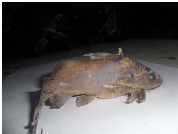
Fig. 5. Synodontis budgetti

Règne : Animal Embranchement : Chordata Sous-embranchement : Vertebrata Super-classe : Osteichthyes Classe : Teleostei Sous-classe : Actinoptérygiens Ordre : Siluriformes Famille : Mochokidae Genre : Synodontis Espèce : Synodontis decorus , Boulenger 1899.