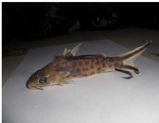
Fig. 3. Synodontis pleurops

Ordre : Characiformes Famille : Citharinidae Sub-famille : Distichodontidae Genre : Distichodus Espèce : Distichodus sexfasciatus , Müller et Troschel 1844.