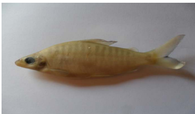
Fig. 1. Distichodus rostratus

Distichodus rostratus , Günther 1864, (Mukasa)