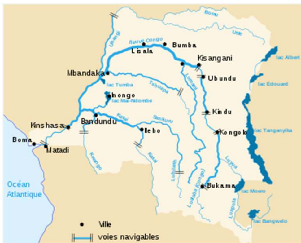
Figure 1 : Carte hydrographique du Congo

Notons que, La ville de Kindu est traversée par le fleuve Congo qui sépare la commune d'Alunguli de celle de Kasuku et Mikelenge. Les affluents du fleuve Congo qui se trouvent de part et d'autres dans cette partie sont : Rivière Mikelenge, Lwandoko, Kindu, Misengé, Kange, Mesobo, Lononga.