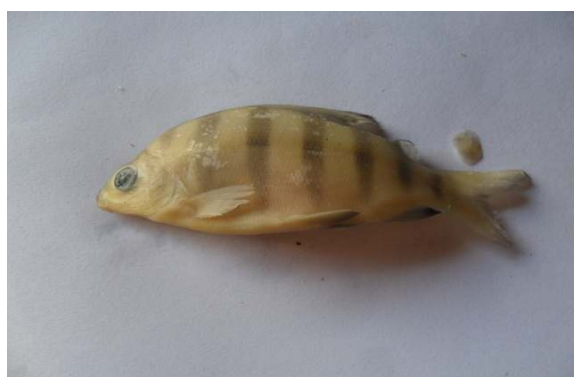
Fig. 2. Distichodus sexfasciatus

Espèce : Distichodus rostratus , Günther (1864)